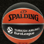
ユーロリーグ (ヨーロッパ)