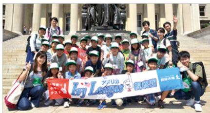
アメリカ Ivy League 視察団 (主催：四谷大塚)