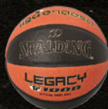
リーガ・エンデサ (スペイン)