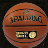
Beko BBL (ドイツ)