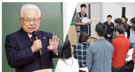
各界トップの視点を学ぶ、究極のモチベーション講座 「トップリーダーと学ぶワークショップ」

学力だけではなく心知体のバランスのとれた「独立自尊の社会・世界に貢献する人財を育成する」ためにナガセの教育ネットワークは、これからも進化を続けます。