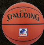
東アジアスーパーリーグ (東アジア)