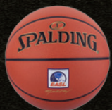
東アジアスーパーリーグ (東アジア)