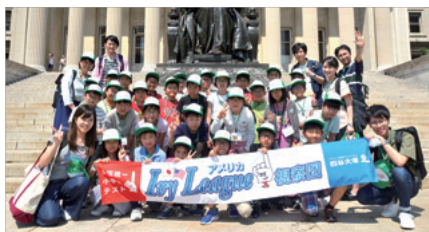
アメリカ Ivy League 視察団 (主催：四谷大塚)