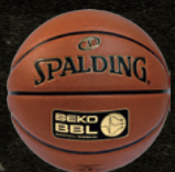
Beko BBL (ドイツ)