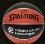
ユーロリーグ (ヨーロッパ)