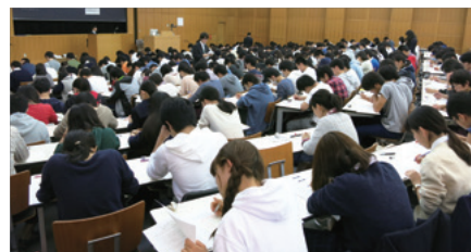
全国統一テスト (小・中・高) を全国で 年2回開催 (無料招待)